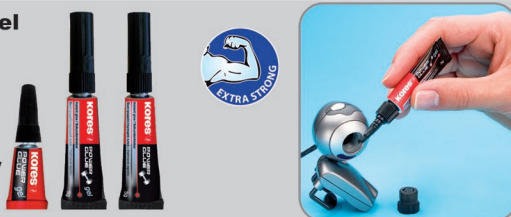
3x1 g/3 g/3 g