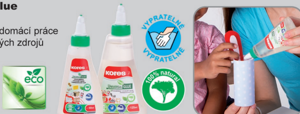
60 ml/125 ml