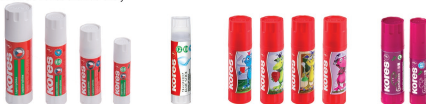
40 g/20 g/15 g/8 g 21 g 15 g 15 g/8 g