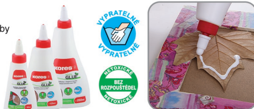
60 ml/125 ml/250 ml