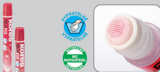
50 ml/30 ml